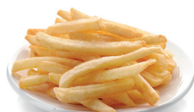
45 g de frites