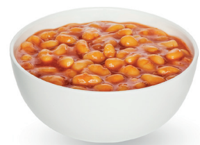
20 g de haricots blancs