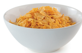
15 g de corn flakes